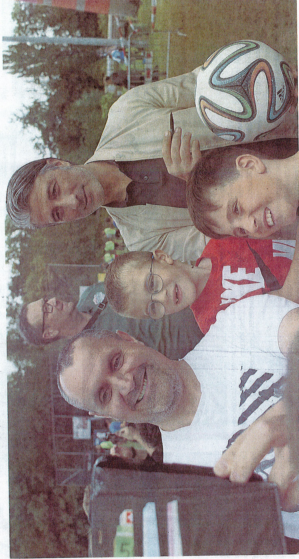
Nationaltrainer Murat Yakin lächelte gestern Abend in zahlreiche Handy-Kameras. Er mache das gern, sagte der Oberegstringer.

zur Verfügung und wechselte ein paar Worte mit den Fans. «Solche Sachen mache ich gerne», so Yakin. Es gehöre zwar auch zu seinem Job, die Nähe zum Volk zu suchen. «Aber ich war selbst einmal jung und habe damals auch zu den bekanntesten Sportlern