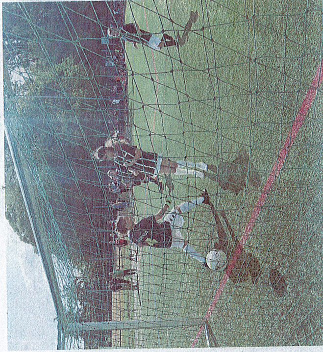
Und wieder fällt ein Tor - hier beim Spiel der Züri Kids.